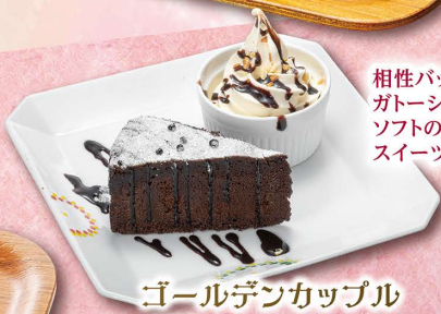
ゴールデンカップル 650円 (税込715円)