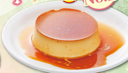
手造りプリン 430円 (税込473円)