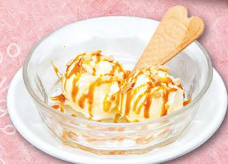
バニラアイスの キャラメルソース 360円 (税込396円)