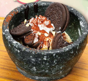
クッキーも 一緒にまぜまぜ♪ まぜまぜ クッキークリーム風 アイス 540円 (税込594円)