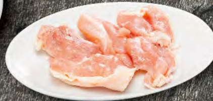
鶏もも 490円 (税込539円)