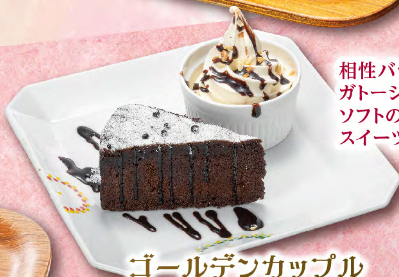
ゴールデンカップル 650円(税込715円)