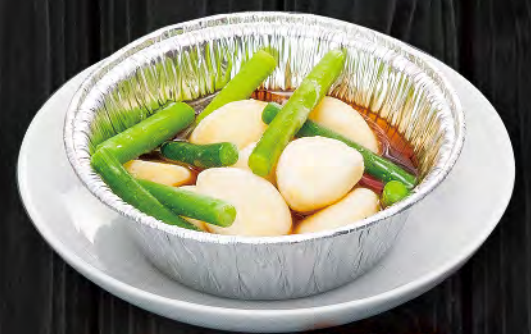
にんにくオイル焼 390円 (税込429円)