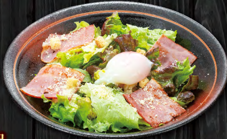
シーザーサラダ温玉のせ 700円 (税込770円)