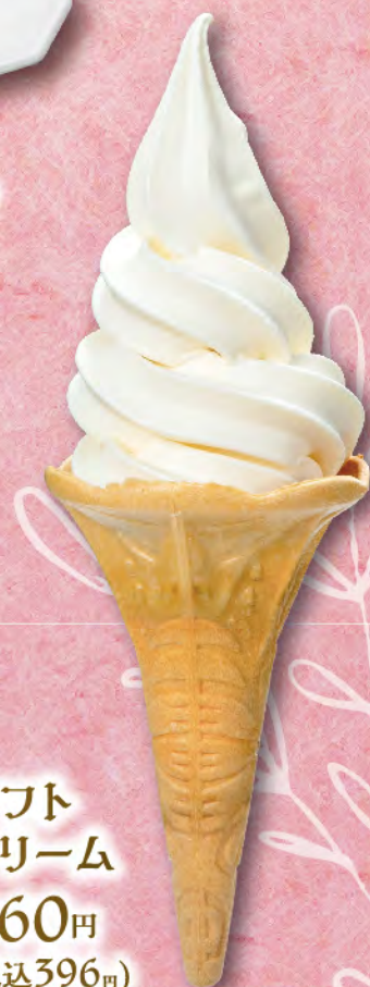
ソフト クリーム 360円 (税込396円)