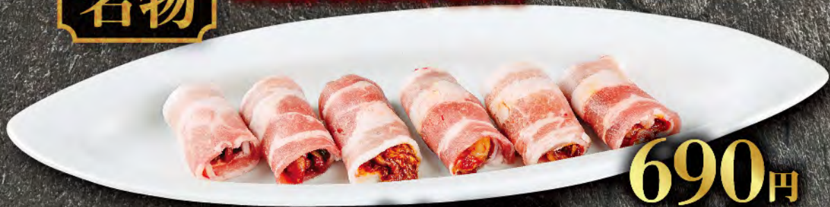
キムチ豚巻 6個 690円 (税込759円)