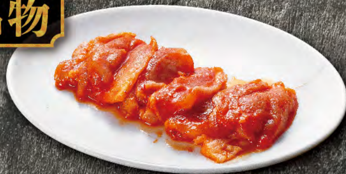
旨辛鶏 560円 (税込616円)