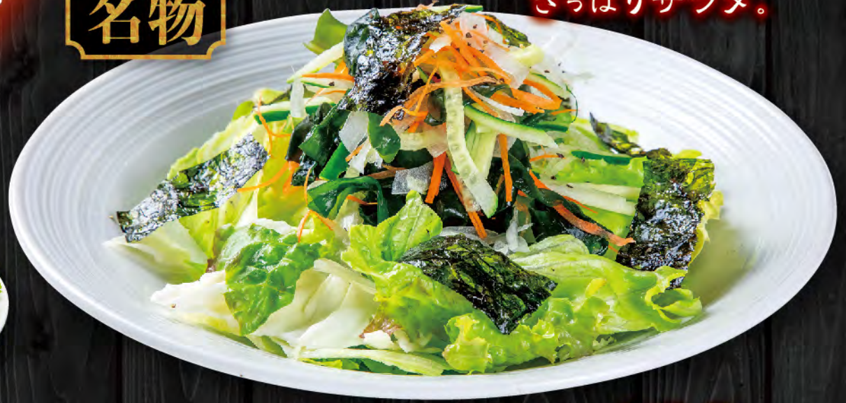
塩チョレギサラダ 630円 (税込693円)