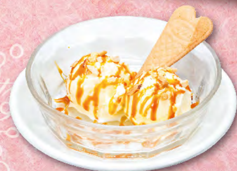
バニラアイスの キャラメルソース 360円(税込396円)