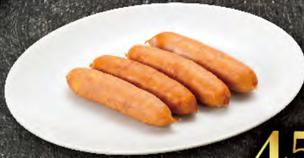
チーズウインナー 450円 (税込495円)