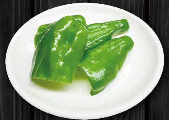
ピーマン 300円 (税込330円)