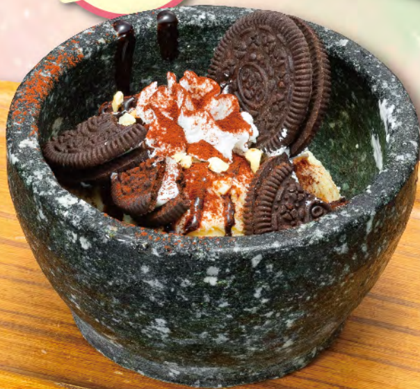
クッキーも 一緒にまぜまぜ♪ まぜまぜ クッキークリーム風 アイス 540円(税込594円)