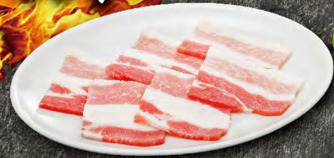
豚カルビ 520円 (税込572円)