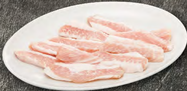
トントロ 520円 (税込572円)