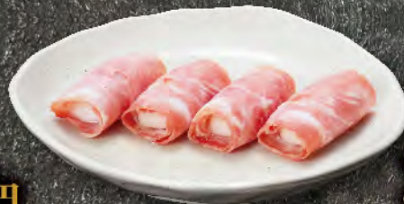
もちベーコン 390円 (税込429円)