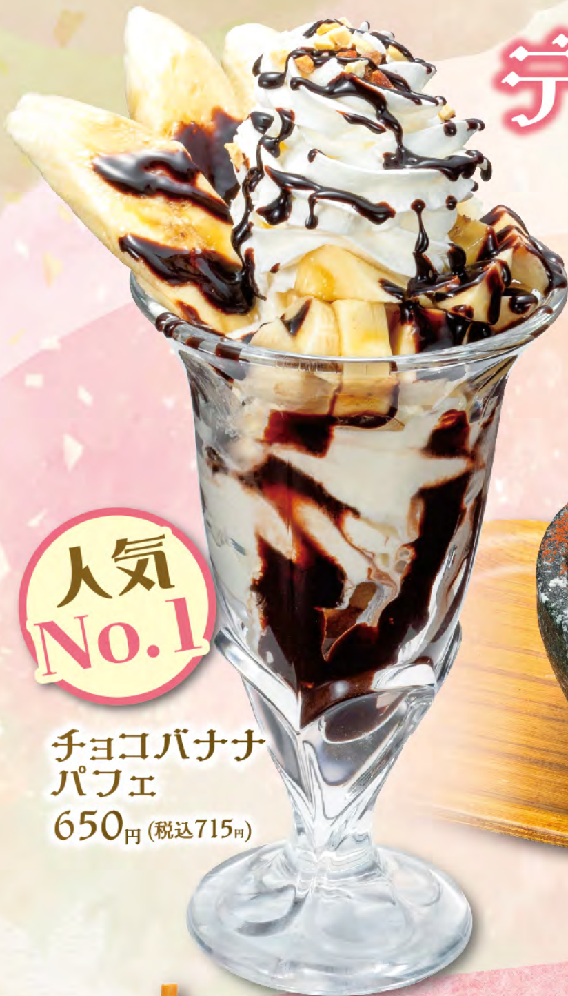
チョコバナナ パフェ 650円(税込715円)