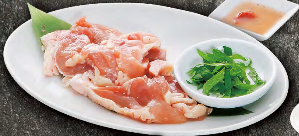
梅しそ鶏 620円 (税込682円)