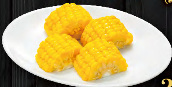
とうもろこし 390円 (税込429円)