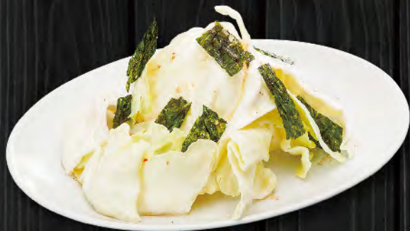
やみつきキャベツ 330円 (税込363円)