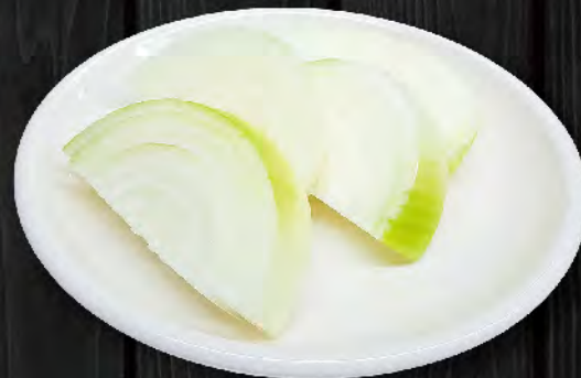
玉ねぎ 300円 (税込330円)