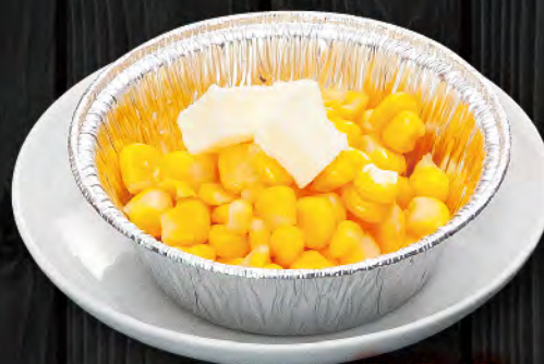
コーンバター焼 390円 (税込429円)