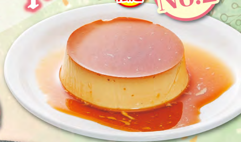
手造りプリン 430円(税込473円)