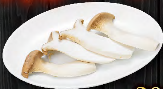
エリンギ 300円 (税込330円)