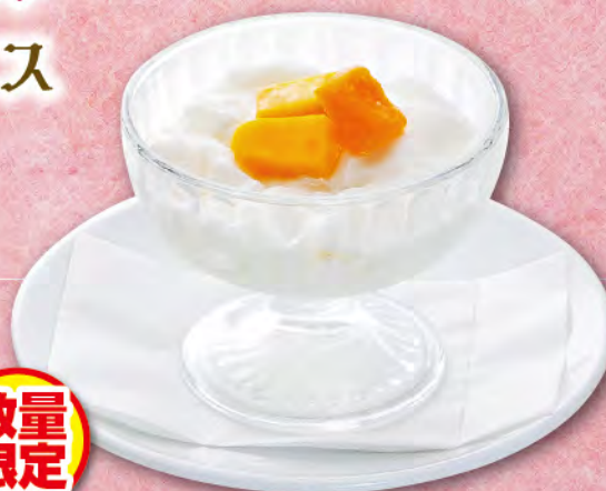
手造り杏仁豆腐 430円(税込473円)