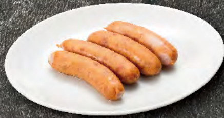
ウインナー 430円 (税込473円)