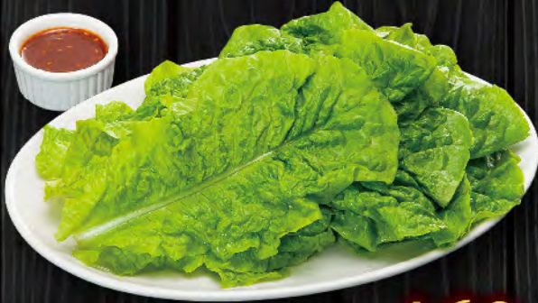
サンチュ (10枚) 460円 (税込506円)