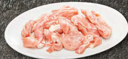
鶏せせり 490円 (税込539円)