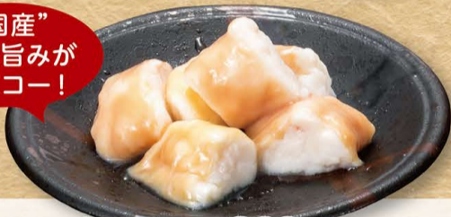
国産牛 丸腸 860円 (税込946円)