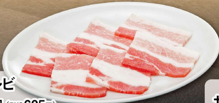
豚カルビ 550円 (税込605円)