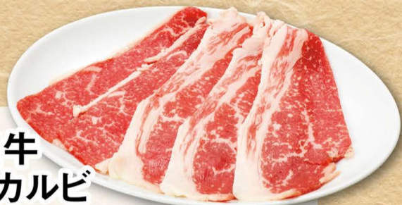
国産牛 炙りカルビ