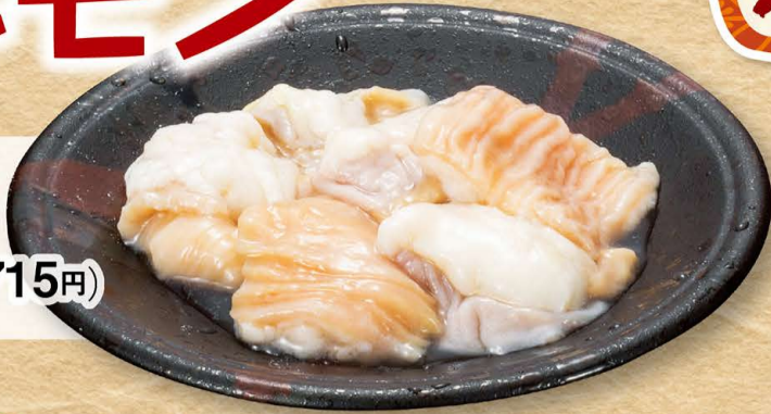
牛ホルモン 650円 (税込715円)