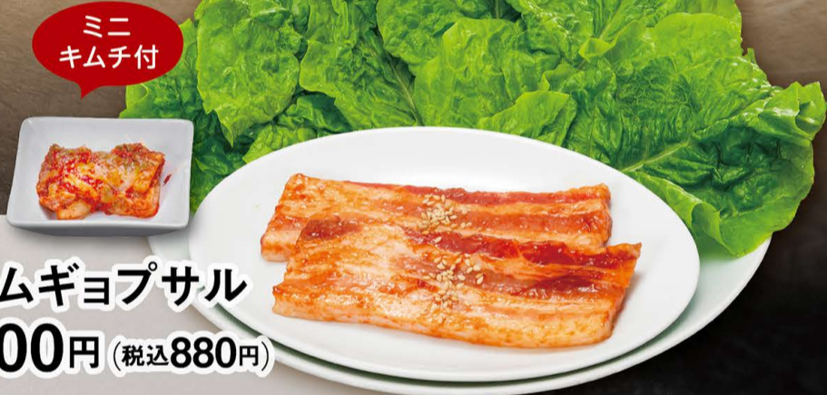
サムギョプサル 800円 (税込880円)