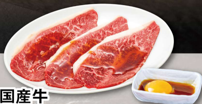
国産牛 ミスジ焼すき 730円 (税込803円)