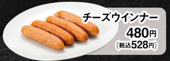
チーズウインナー 480円 (税込528円)