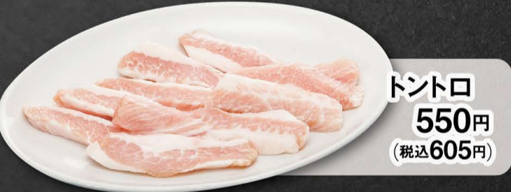
トントロ 550円 (税込605円)