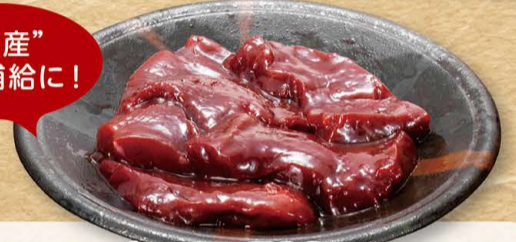
国産牛 レバー 580円 (税込638円)