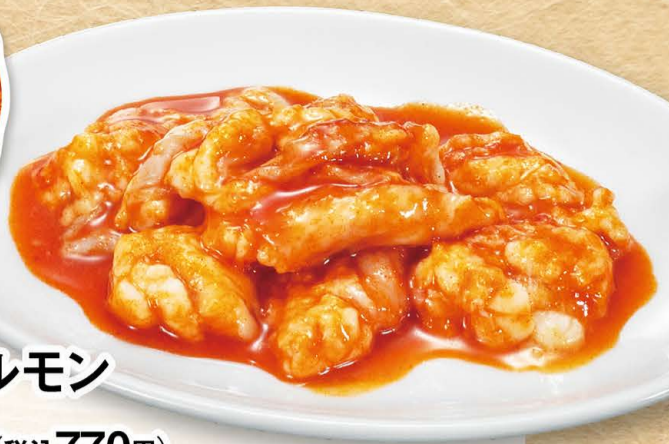
旨辛ホルモン 700円 (税込770円)