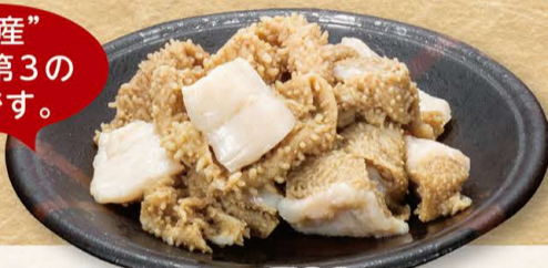
国産牛 センマイ 580円 (税込638円)