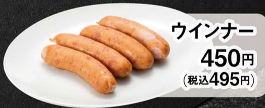
ウインナー 450円 (税込495円)