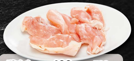
鶏もも 490円 (税込539円)

※写真はタレが付いておりませんが、実際の注文商品にはタレがかかっております。 ※盛り付けは写真と異なる場合がございます。