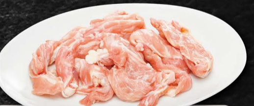
鶏せせり 490円 (税込539円)