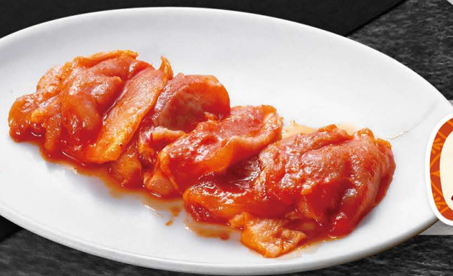
旨辛鶏 560円 (税込616円)