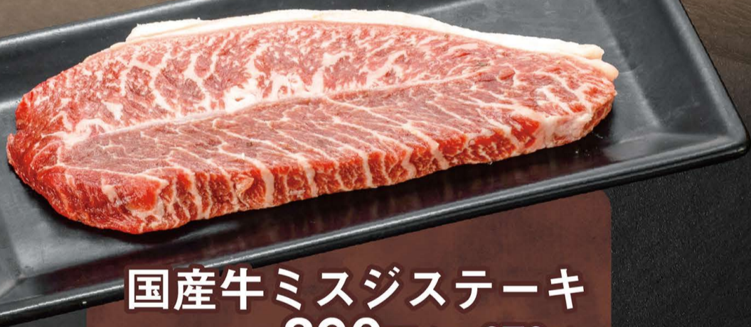
国産牛ミスジステーキ 890円 (税込979円)