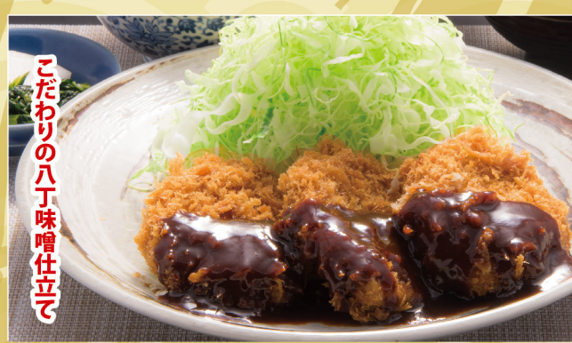
こだわりの八丁味噌仕立て

和風ネギおろし膳 ローズ 1450円 (税込1595円) ヒレ 1550円 (税込1705円)