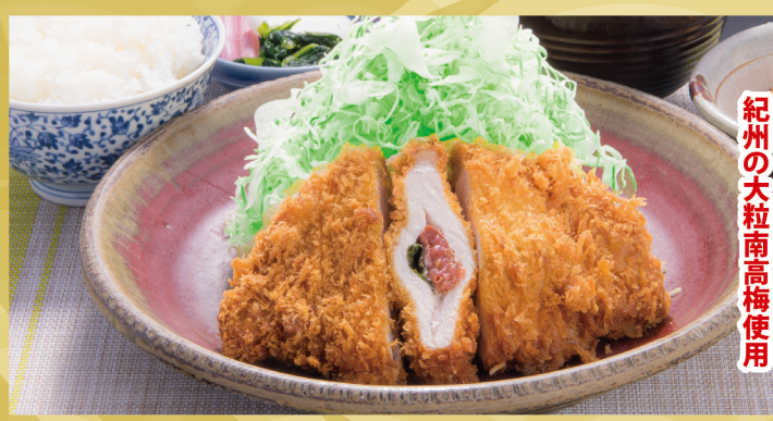
紀州の大粒南高梅使用