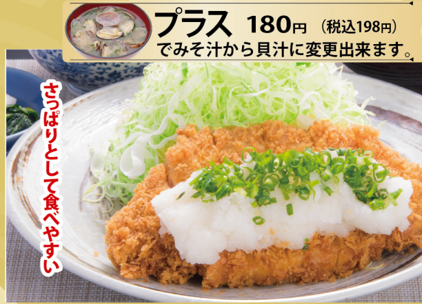
サッパリとくっついて食べやすい

美味しい感動 カツカレー ローズ 1150円 (税込1265円) ヒレ 1150円 (税込1265円)