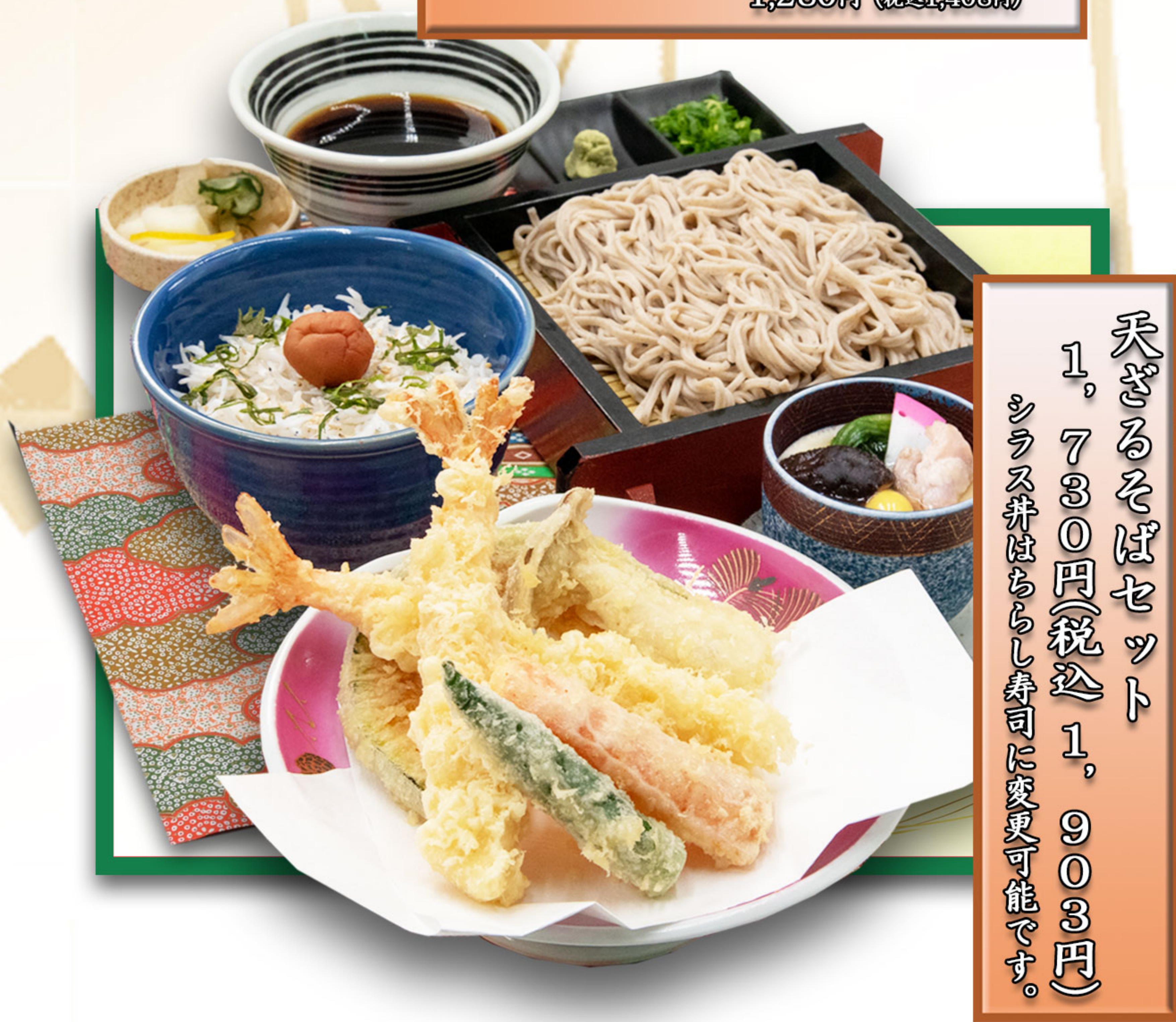
天ざるそばセット