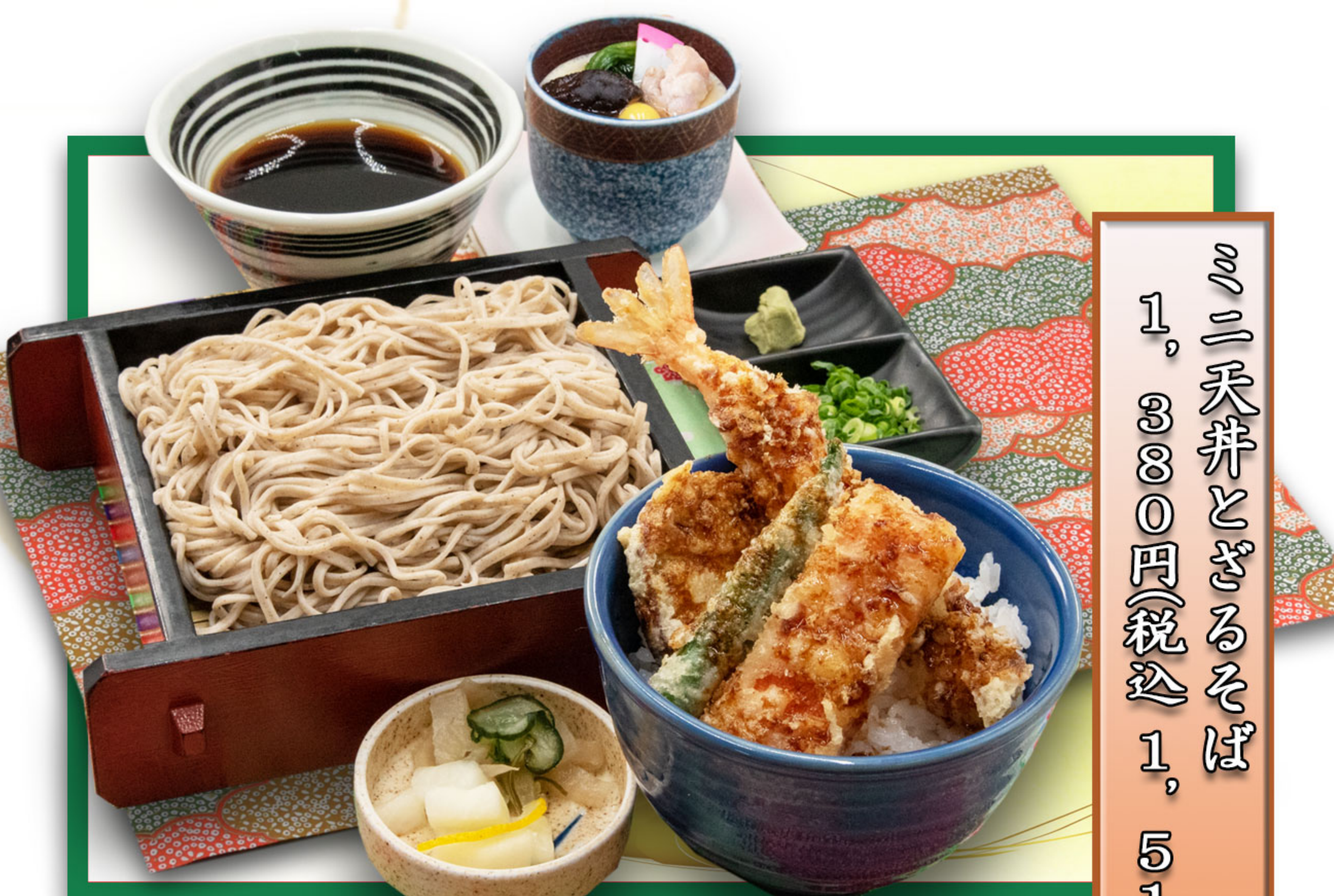
ミニ天丼とざるそば