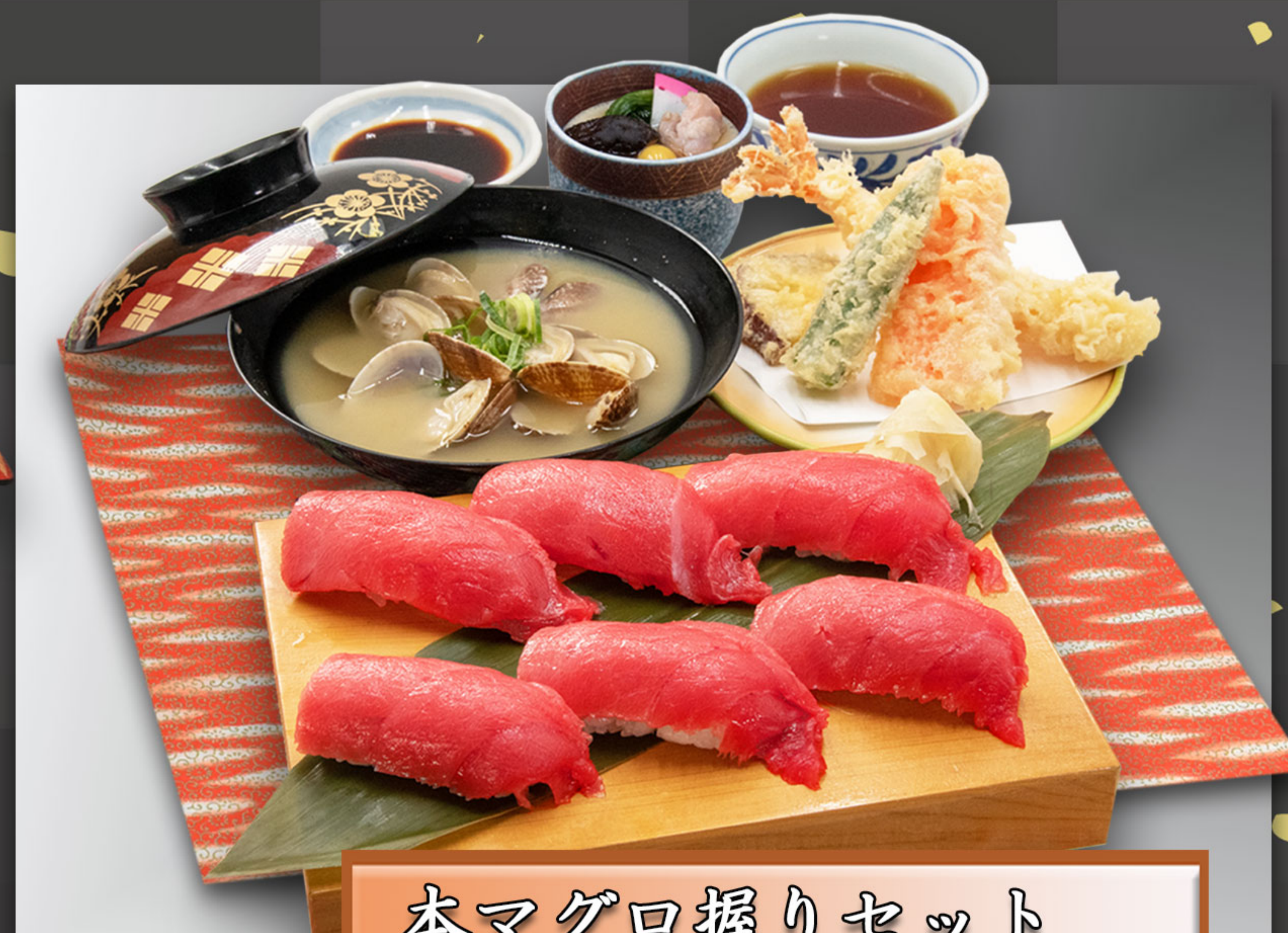
本マグロ握りセット