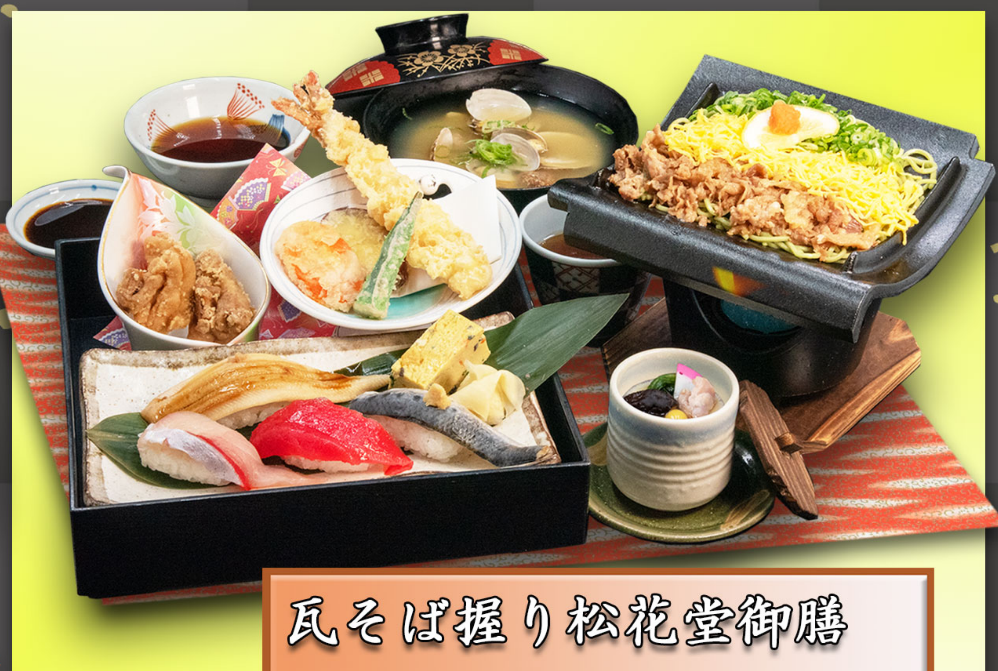
瓦そば握り松花堂御膳