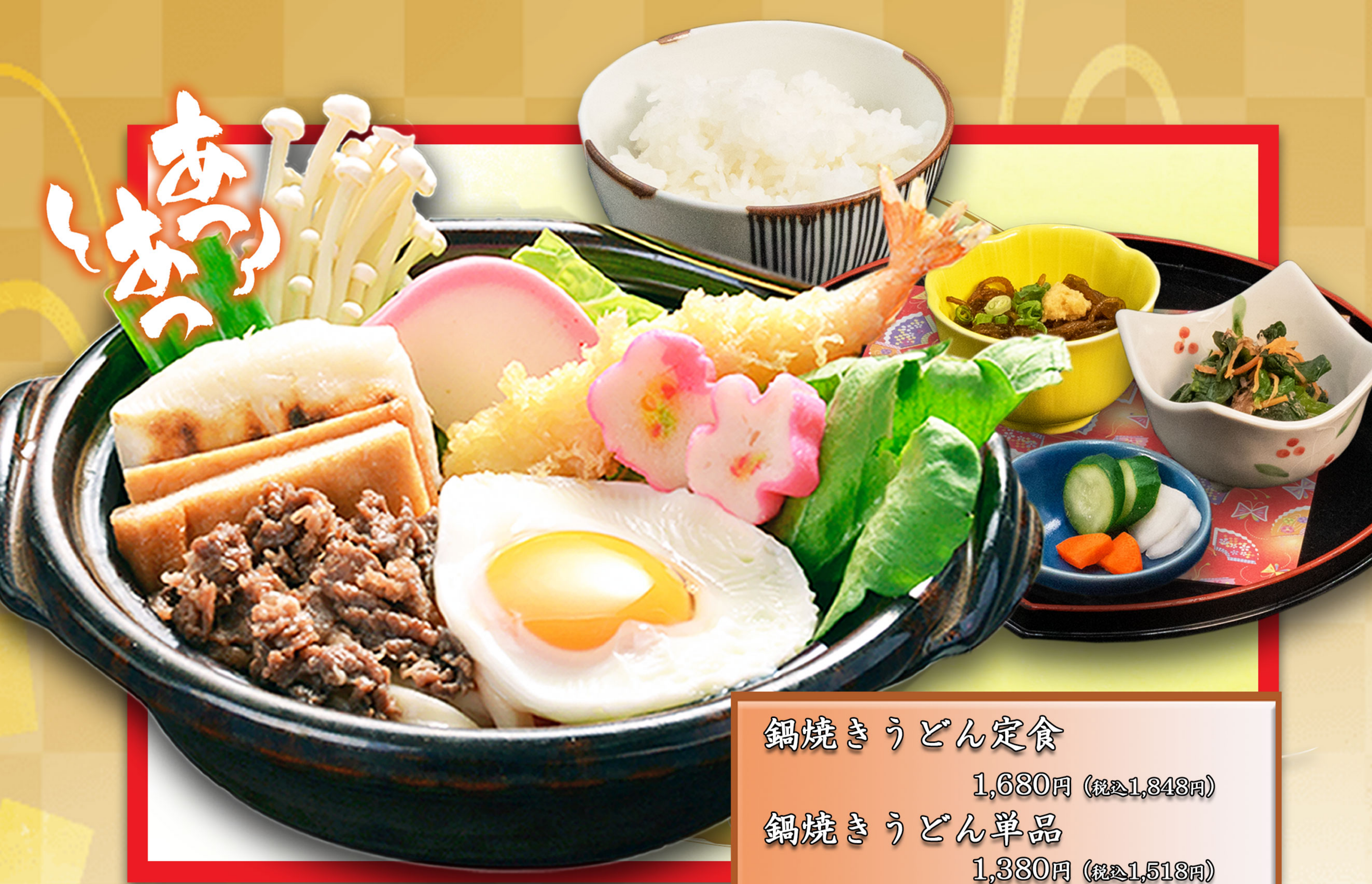
鍋焼きうどん定食