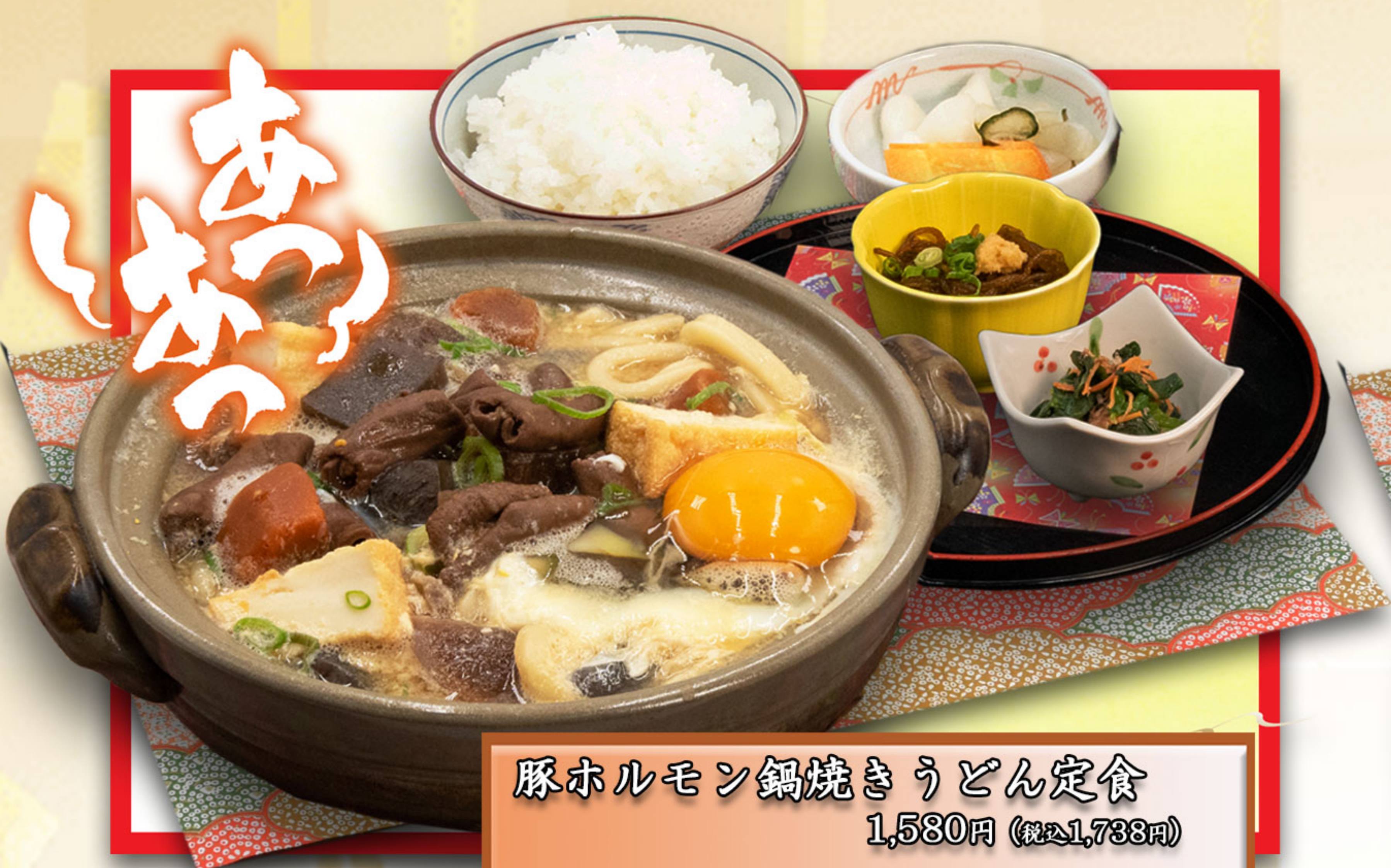
豚ホルモン鍋焼きうどん定食